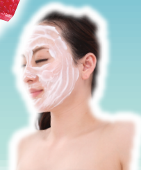
スポンジチーフ(イメージ)